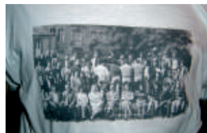
...et il y a 30 ans !

rêves... Les diplômés ont ainsi pu partager leur expérience avec les jeunes, mais aussi avec leurs "collègues". Quelques étudiants ont profité de l'occasion pour rencontrer leur