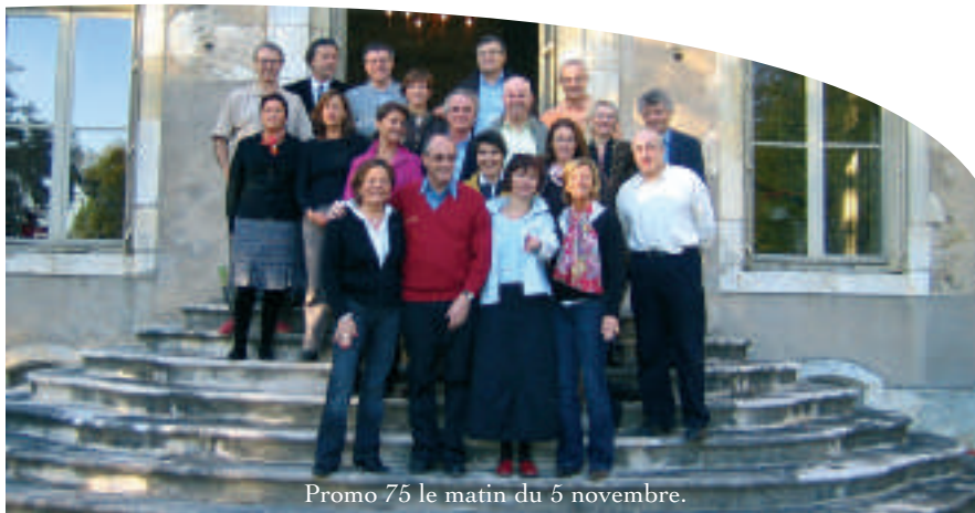
Promo 75 le matin du 5 novembre.

Ce même jour aussi, les café-métier animés par des diplômés ont permis de rencontrer des étudiants et de découvrir les futurs diplômés. Rencontres instructives de part et d'autres, dans les cafés marketing, finance, et MDO/entrepreneuriat, dans trois cafés de la place Stan. Les étudiants ont posé des questions sur les réalités des métiers, les chemins à suivre pour parvenir au poste de ses