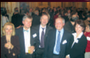
Une nombreuse assemblée.